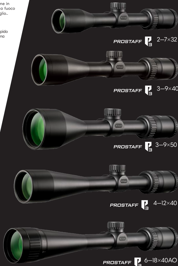
PROSTAFF P3 2-7x32